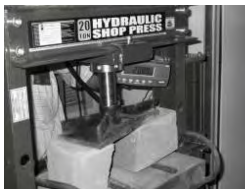
Ensayo de flexión, rotura bloque a 2.080 kg (0,72 MPa)