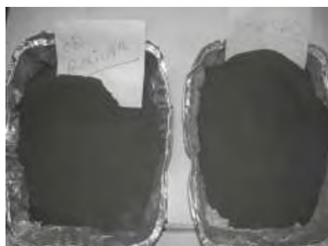
Muestras de suelo de Soledad y Ciudad Bolívar