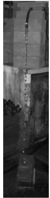
Izq: Ensayo de Impacto (altura 6 m); Der: Ensayo erosión por goteo (altura 1,50 m)