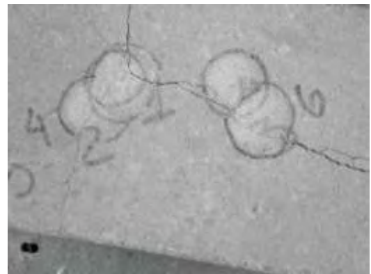
Ensayo de Impacto (huellas de diferentes caídas)