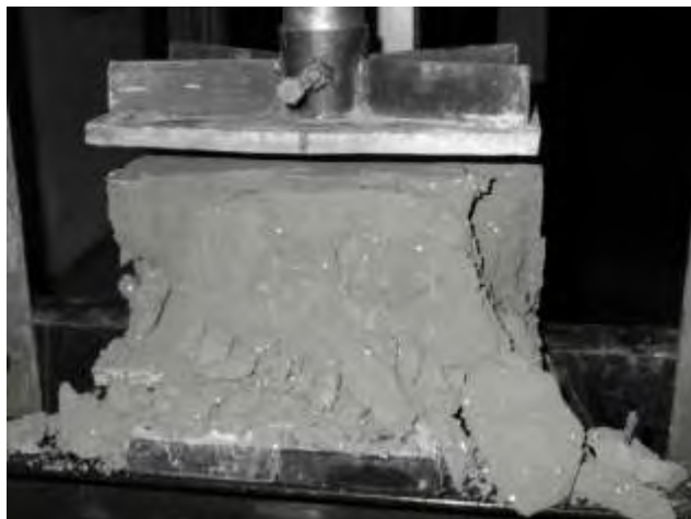
Ensayo de Compresión simple en muretc de bloque BTC.