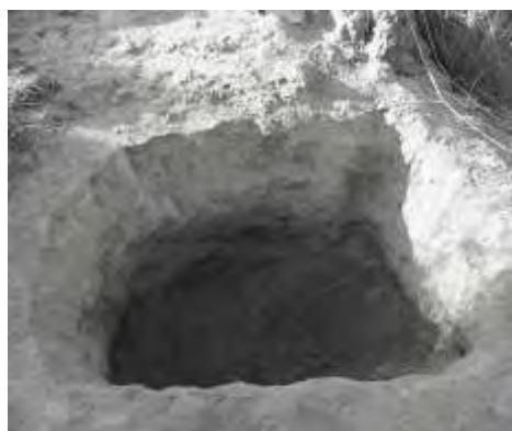
Calicata de muestreo, sector Soledad