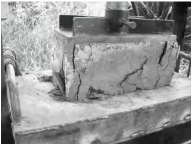
Ensayo de compresión simple, grietas a carga de F = 20 \text{ Tm} (4,76 MPa)