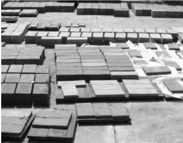
Patio de patios fabricados