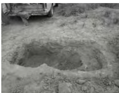
Calicata de muestreo, sector Ciudad Bolívar